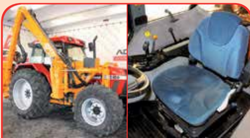
CASE MAXXUM 5150 anno 1994, 125cv da 30.000 €