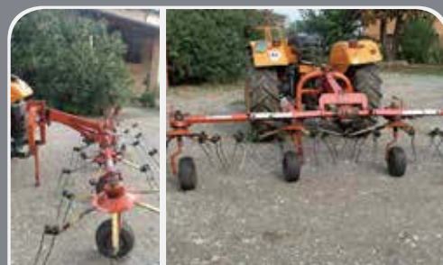
GIROVOLTAFIENO GALFRE' 4 giranti, lunghezza lavoro 4.20 mt. - 2.000 € a Montichiari (BS) Tel 335/273965