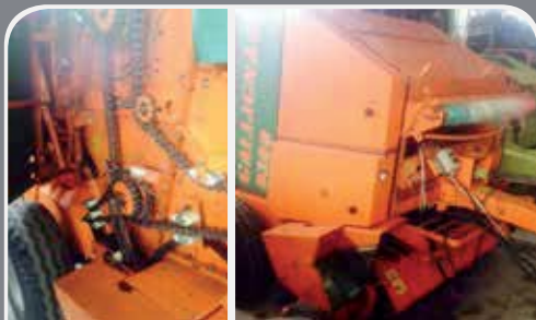
Rotopressa GALLIGNANI mod. 9300 SL Cinghie e pick-up nuovi, legatore a spago e rete automatico - a 5.000 € trattabili - Vera occasione BICELLI, LONATO DEL GARDA (BS) - Tel. 328/1757252