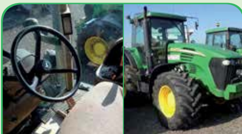
JOHN DEERE 7720 anno 2005, 190 CV da 49.000 €