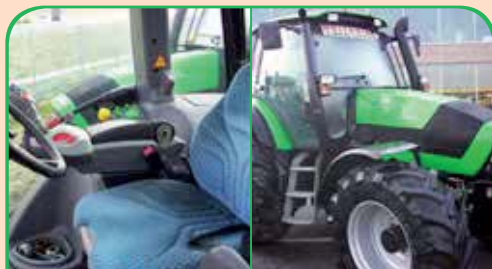
DEUTZ TTV 1145 anno 2007, 150 CV da 39.000 €