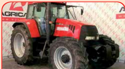
CASE CVX 170 anno 2002, 170cv da 25.000 / 35.000 €