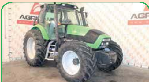
DEUTZ 165.7 anno 2004/2005, 170 CV da 39.000 / 38.000 €