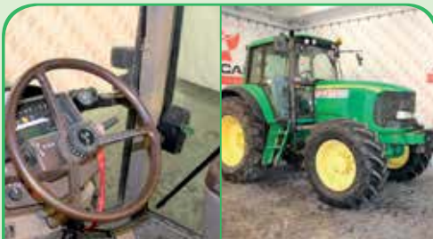
JOHN DEERE 6820 anno 2004/2005, 150 CV da 40.000 €