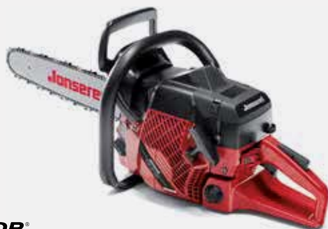
ULTICOR® CLEAN POWER™ JONSERED CS 2166