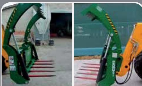
FORCA TAGLIABALLONI mod. "PEDROTTI 3 IN UNO", ottobre 2013, usata pochissimo, causa inutilizzo - 3.000 € SOCIETA AGRICOLA MOTTELLA BASSA DI CAUZZI, CAVRIANA, Tel. 389/6762813