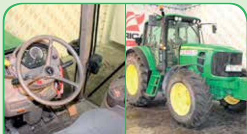
JOHN DEERE 6930P anno 2007, 187 CV da 39.000 / 44.000 €