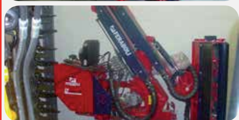
DECESPUGLIATORE FDR3 500/100

Lunghezza braccio 5 mt, testa da 1.05 mt a 8.000 € + IVA