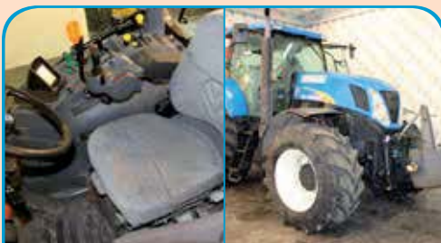
NEW HOLLAND T7040 anno 2007, 185 CV da 49.000 €