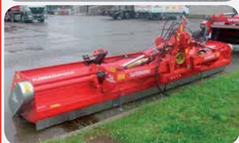
TRINCIA DUPLO FLORDIA M520