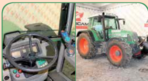
FENDT 716 anno 2004, 169cv da 45.000 €