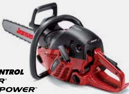
CARB CONTROL ULTICOR® CLEAN POWER™ JONSERED CS 2258