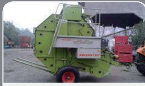
ROTOPRESSA CLASS ROLLANT 62 del 1995 circa, rotopressa a rulli, legatura a spago e a rete con espulsore balle. 2.900 € Disponibile nella azienda agricola a Montichiari (BS) al numero 335/273965