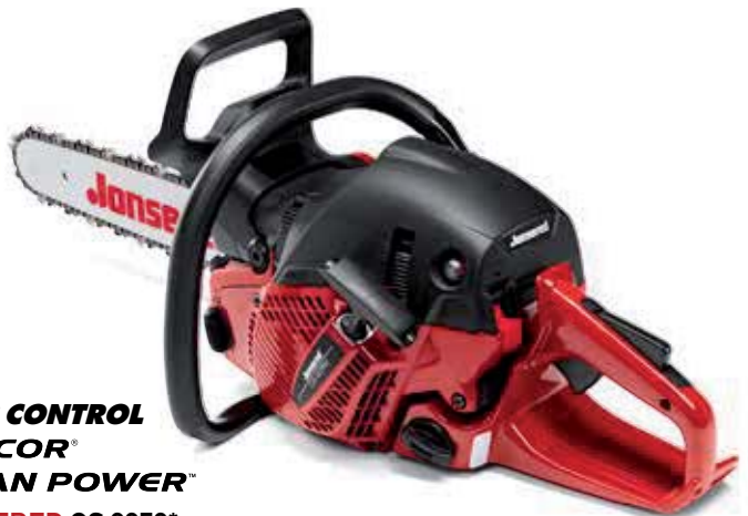
CARB CONTROL ULTICOR® CLEAN POWER™