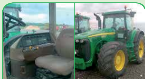
JOHN DEERE 8420 anno 2002, 300 CV da 65.000 €