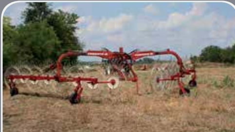
RANGHINATORE Marca ABBRIATA mod. 8+8 Stelle, larghezza mt 8,7 idraulico a € 7.000

LAZZARI GIANPAOLO di Mazzano (Bs) Tel. 334/9012431 - 334/9012431