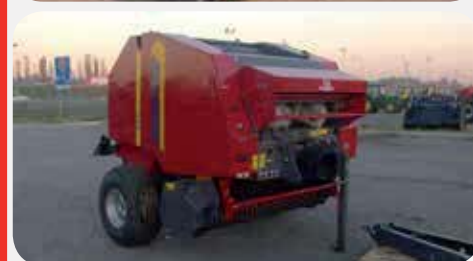
ROTOPRESSA TROTTER 125-35