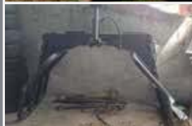
CARRO EUROCOMP DUALMIX 8M³ Carro unifeed orizzontale Eurocomp due coclee, 8 m³, con pesa e fresa con motore x lo letto più piedi- no idraulico. 3.500 €

MAGHELLA MAURO di Castiglione d/S (MN) tel. 340/0718820 - 340/0718820