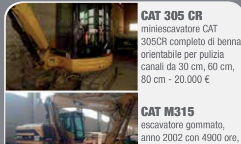
CAT 305 CR miniescavatore CAT 305CR completo di benna orientabile per pulizia canali da 30 cm, 60 cm, 80 cm - 20.000 €