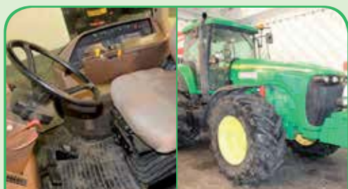
JOHN DEERE 8220 anno 2002, 250 CV da 59.000 €