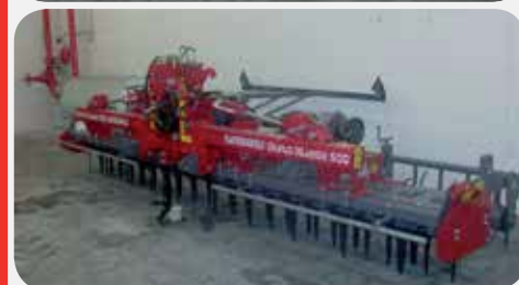
ERPICE XL500 DUPLO

Coltelli sgancio rapido, kit frangizolle e rompitraccia a 14.990 € + IVA