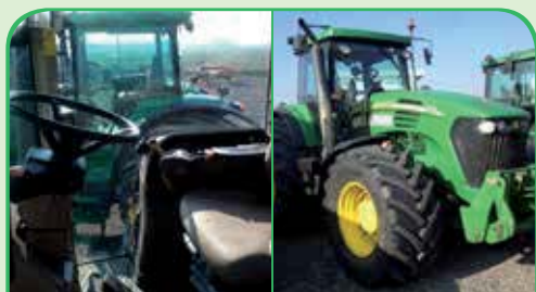
JOHN DEERE 7920 anno 2004, 210 CV da 49.000 / 53.000 €

* Tutti i prezzi sono da considerarsi già scontati