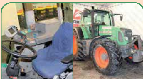
FENDT 818 anno 2003, 195cv da 58.000 €