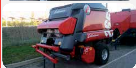
ROTOPRESSA EXTREME 265 HTC

Camera variabile geometria variabile. a 25.000 € + IVA