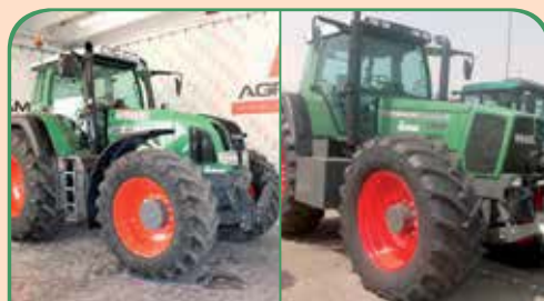
FENDT 926 anno 2000/2001, 260 CV da 38.000 / 62.000 €