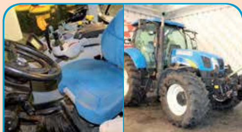
NEW HOLLAND T6080 anno 2009, 178 cv da 50.000 €