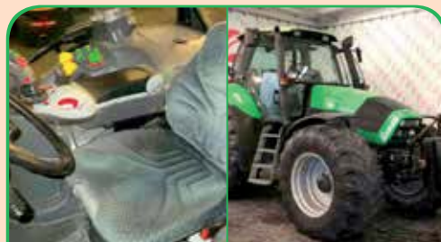
DEUTZ 180.7 anno 2007, 180 CV da 42.000 €