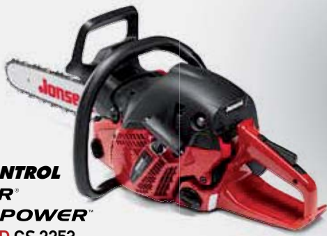
CARB CONTROL ULTICOR® CLEAN POWER™ JONSERED CS 2253