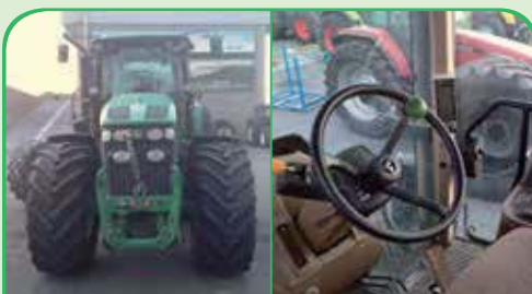
JOHN DEERE 7930 anno 2008, 220 CV da 80.000 €