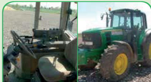
JOHN DEERE 6930 anno 2010, 160 CV da 44.000 €