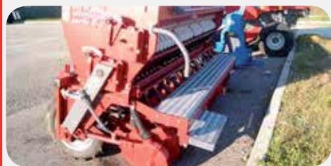
FS70/3 SEMINATRICE VITTORIA UNIVERSAL E-2

Mt 3X23 file e dischi doppi, kg720 a 6.400 € + IVA