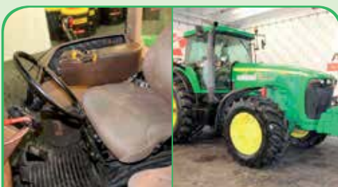
JOHN DEERE 8320 anno 2002, 276 CV da 59.000 / 65.000 €