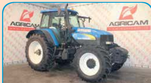
NEW HOLLAND TM 190 anno 2003/2004, 230 CV da 35.000 €