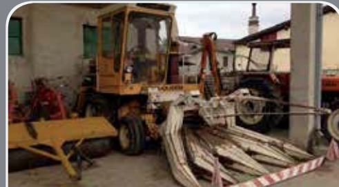
TRINCIATA FIELD QUEEN HESSTON DA 238CV fila coltelli idraulico, idrostatico, frizione nuova, TUTTA FUNZIONANTE - a 4000 € trattabili