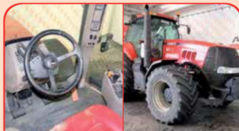
CASE MAXXUM 310 anno 2008, 310cv da 75.000 €