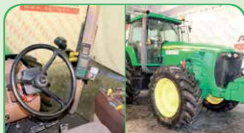
JOHN DEERE 8120 anno 2003, 220 CV da 45.000 €