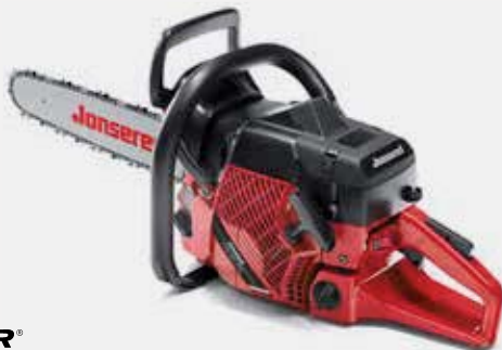
ULTICOR® CLEAN POWER™ JONSERED CS 2172