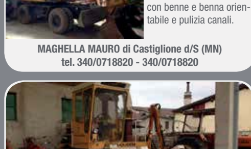
CAT M315 escavatore gommato, anno 2002 con 4900 ore, con benne e benna orien- tabile e pulizia canali.