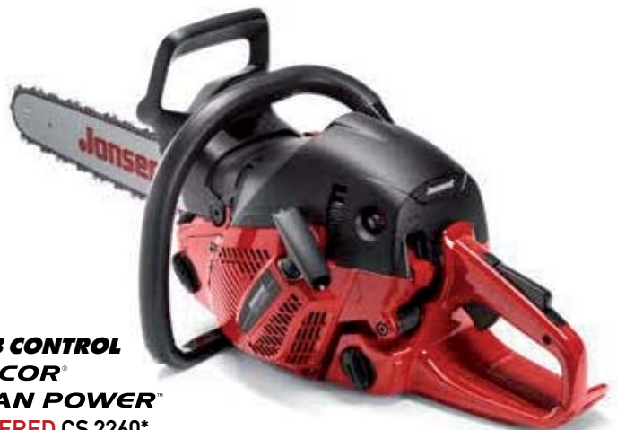
CARB CONTROL ULTICOR® CLEAN POWER™