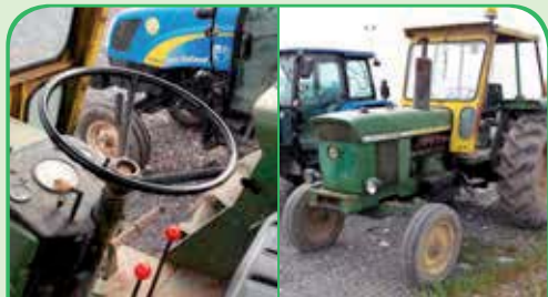
JOHN DEERE 3130 anno 1976, 101 CV da 5.000 €