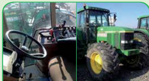
JOHN DEERE 7810 anno 1997, 190 CV da 29.900 €