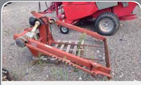
TAGLIA BALLONI PEDROTTI In conto visione presso la nostra sede - 500 € di Montichiari (BS) - per info 030/961185